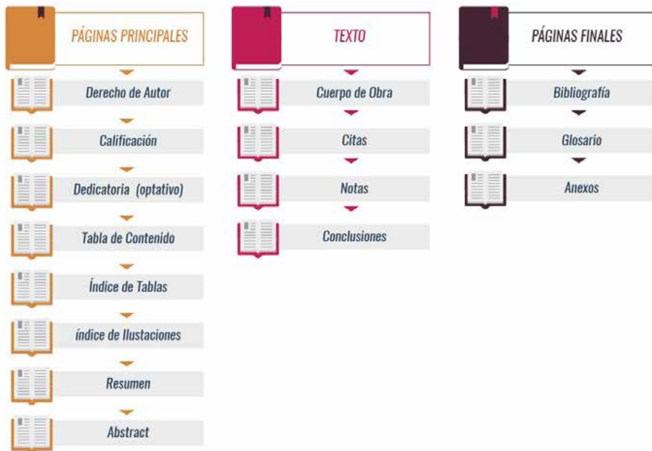
Figura 1. Partes de un Trabajo de Titulación