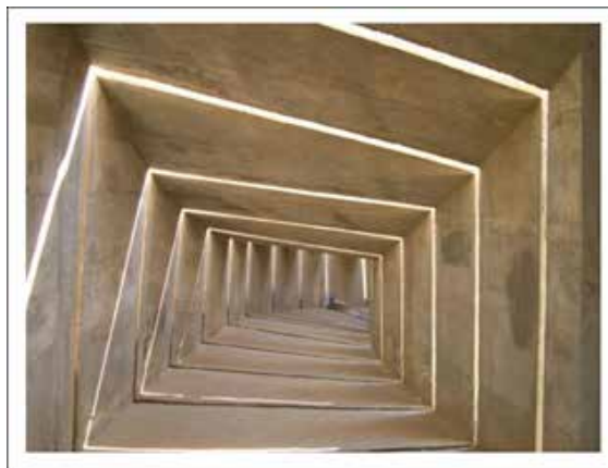
Figura 3. Ejemplo de cómo presentar una ilustración utilizando una foto del monumento a la Brigada del Negev